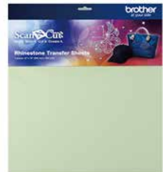
Hoja adhesivo extra para cortar tela