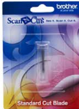
Filo de corte standard