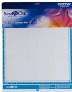
Base de corte Adhesivo bajo 12" x 12"