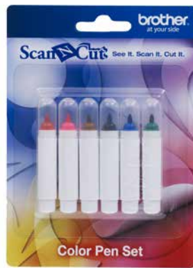
Set de fibras para papel (6 unidades)