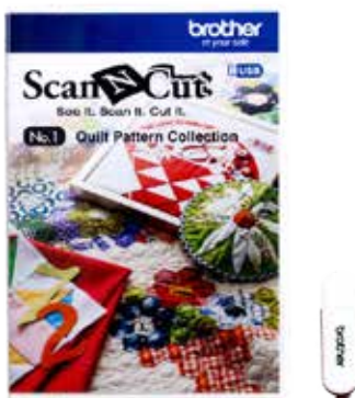
USB con diseños para patchwork