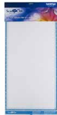
Base de corte standard 12" x 24" Grande