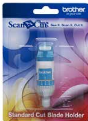
Soporte para filo de corte standard