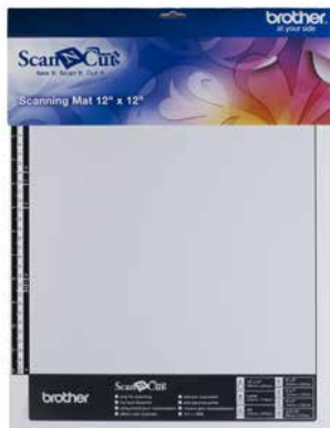
Base de escaneo 12" x 12"