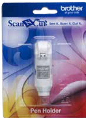
Soporte para fibras