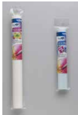
Tela termoadhesiva doble contacto