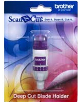
Soporte para filo de corte profundo