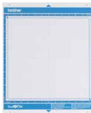
Base de corte standard 12" x 12"